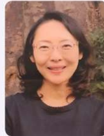
臨床美術士3級 医療法人社団翔洋会 理事