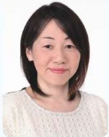
臨床美術士2級 京都<臨床美術>を すすめるネットワーク 代表