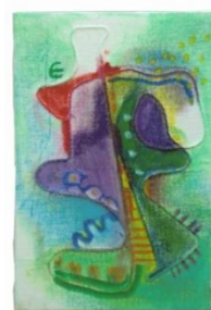
No.13「アナログフロッタージュ」