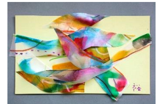
No.15「風の流れのコラージュ」