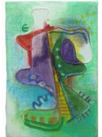
No.13「アナログフロッターージュ」