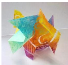
No.16「色彩と空間のコンポジション」