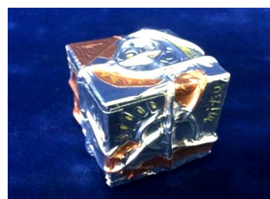
No.7 「アナログメタルキューブ」