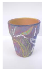
No.7「植木鉢に描く 地中のアナログ画」

《対象》 臨床美術士5級取得以上で日本臨床美術協会資格認定会員の方 ※会員証の有効期限をご確認ください