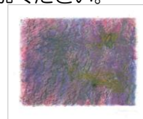
No.4「色面とマチエール」