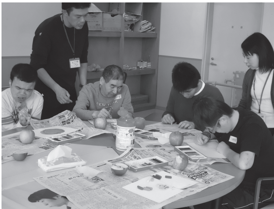
りんごを前に量感画に取り組む

スタッフの方々は、「いつもはすぐに飽きてしまう方が、90分間集中して制作していた」「言葉にするこ