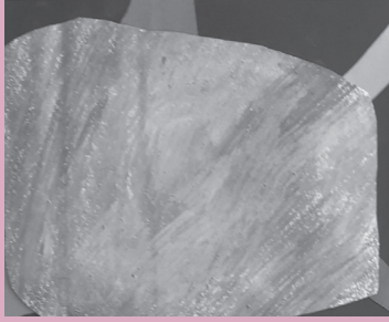
個性豊かなりんごの作品