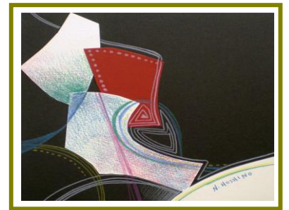
No.9「カラージュパズル」

《対象》 臨床美術士5級取得以上で日本臨床美術協会資格認定会員の方 ※会員証の有効期限をご確認ください