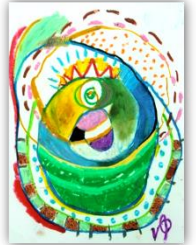
No.3 ワクワクうずまき