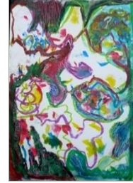
No.1 点から始まるリズム枝・太鼓