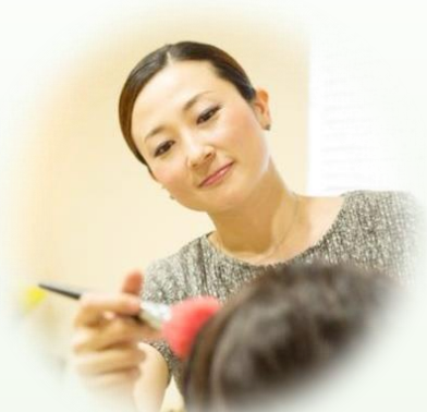
メイク&スキンケア